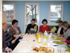
Des jeunes diplômés de travail à la Mission Locale avec ses opérateurs de l'emploi

Sur le bassin d'emploi comme en Seine-et-Marne de façon générale, l'accès à l'alternance est plus difficile que dans d'autres secteurs et départements d'Ile-de-France pour les jeunes de la Mission Locale. Les contrats en alternance profitent surtout aux jeunes diplômés. L'enquête nationale de l'ANDRH de 2011 sur l'insertion des jeunes confirme cette tendance à la surqualification: « les moins qualifiés ayant essentiellement accès à l'intérim et au CDD ». Pourtant, sur le territoire, certaines offres en alternance ne sont pas pourvues faute de candidats